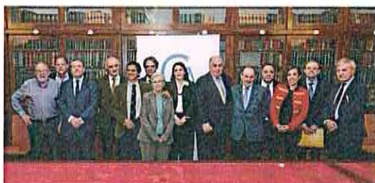
Comisión Científica de la Asociación Española de Derecho Sanitario.

Madrid 26/04/2019 medicosypacientes.com / R. M. Platel